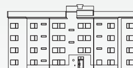
FASAD MOT NORR (GÅRDEN)